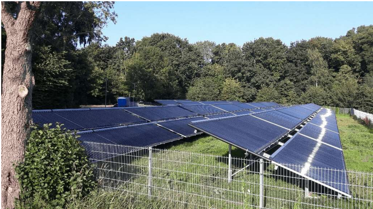
Solarthermieanlage der Bürger GemeindeWerke Breklum eG